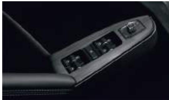
Электростеклоподъемники четырех дверей с автоводчиком со стороны водителя