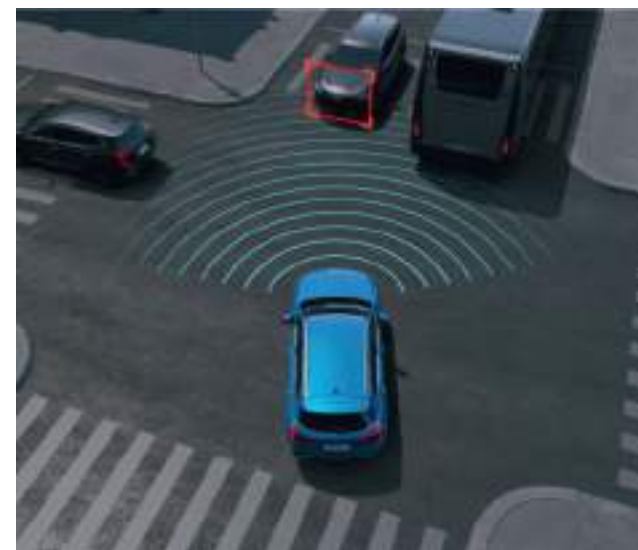
Система помощи при выезде на перекресток