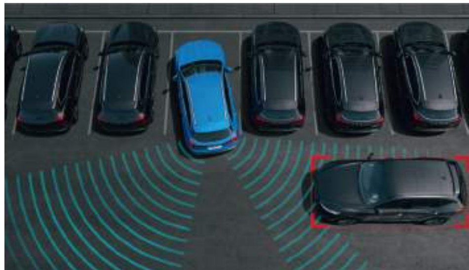
Выезд с парковки задним ходом

Доверьтесь умному ассистенту, который в любой момент подменит вас и поможет осуществить один из самых сложных маневров в городе. При движении задним ходом во время парковки он своевременно распознает другие автомобили или пешеходов и примет экстренные меры по предотвращению столкновения. При выходе из автомобиля система отслеживания помех при открытой двери поможет вам избежать нежелательных ситуаций.