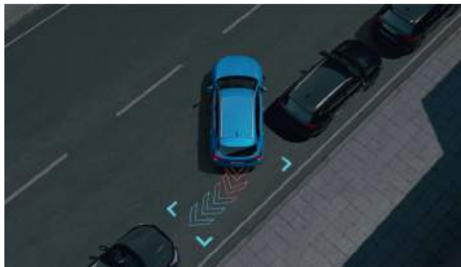
Система автономной парковки