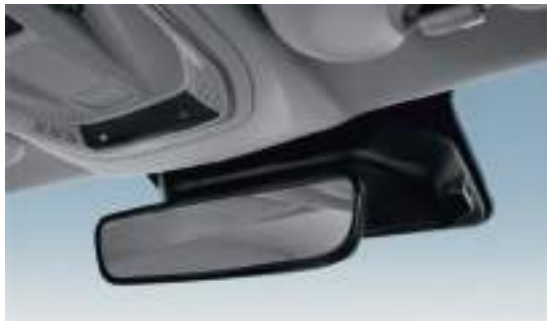
USB-разъем над зеркалом заднего вида