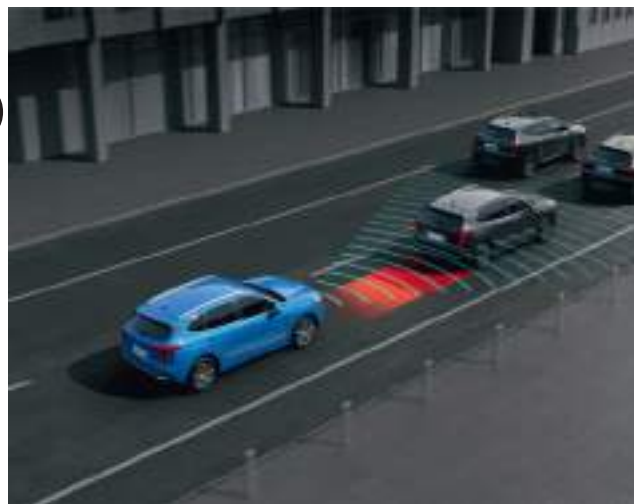
Система экстренного торможения на низких скоростях