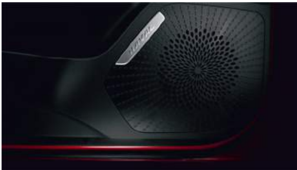
6 динамиков аудиосистемы