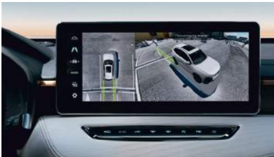
12" Сенсорный дисплей и камера кругового обзора 360°