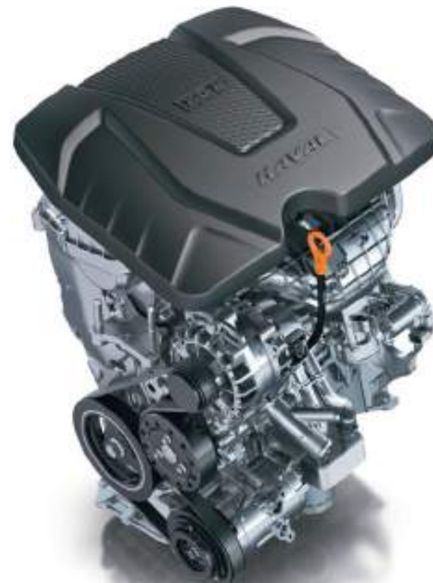
1,5-литровый бензиновый двигатель с турбонаддувом