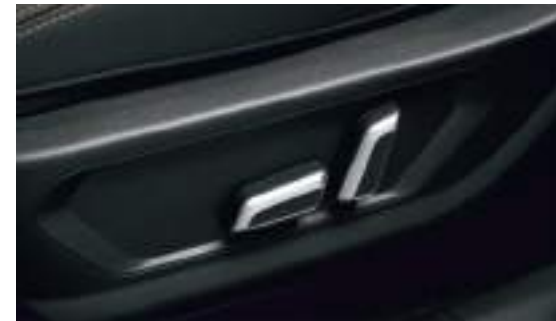
6-позиционная регулировка сиденья водителя с электроприводом