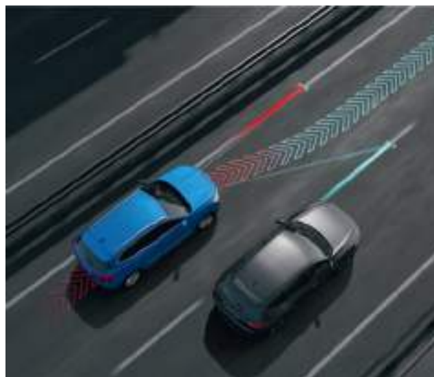
Система помощи удержания в полосе движения и в центре полосы

Получайте всю необходимую информацию о дорожных знаках, приближении пешеходов или велосипедистов, используйте автоматический сброс скорости при возникновении экстренной необходимости даже на малых скоростях, а также помощь при выезде на перекрестки.