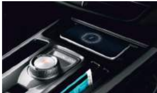
Беспроводная зарядка, 2 слота для телефона — для водителя и пассажира, а также кармашек для нужных мелочей