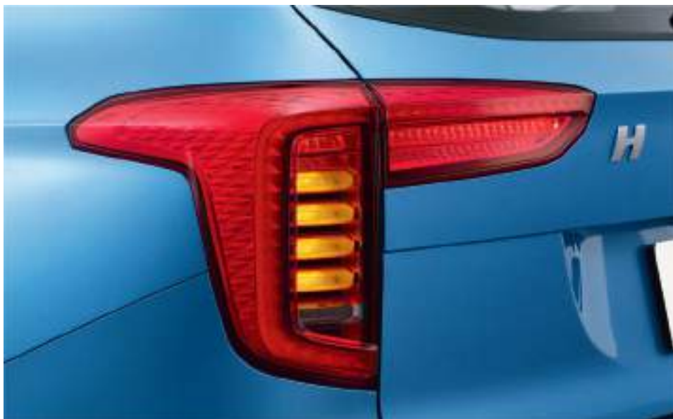
Светодиодные задние фонари