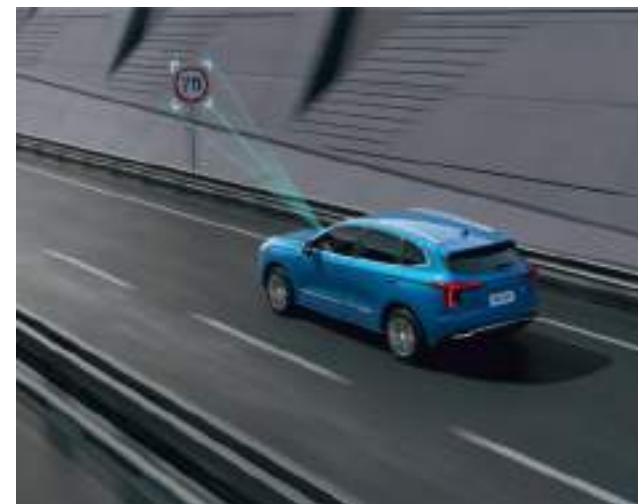
Система распознавания дорожных знаков

Исследуйте мир вместе со встроенным адаптивным круизконтролем и интеллектуальными системами безопасности Haval Smart Drive.