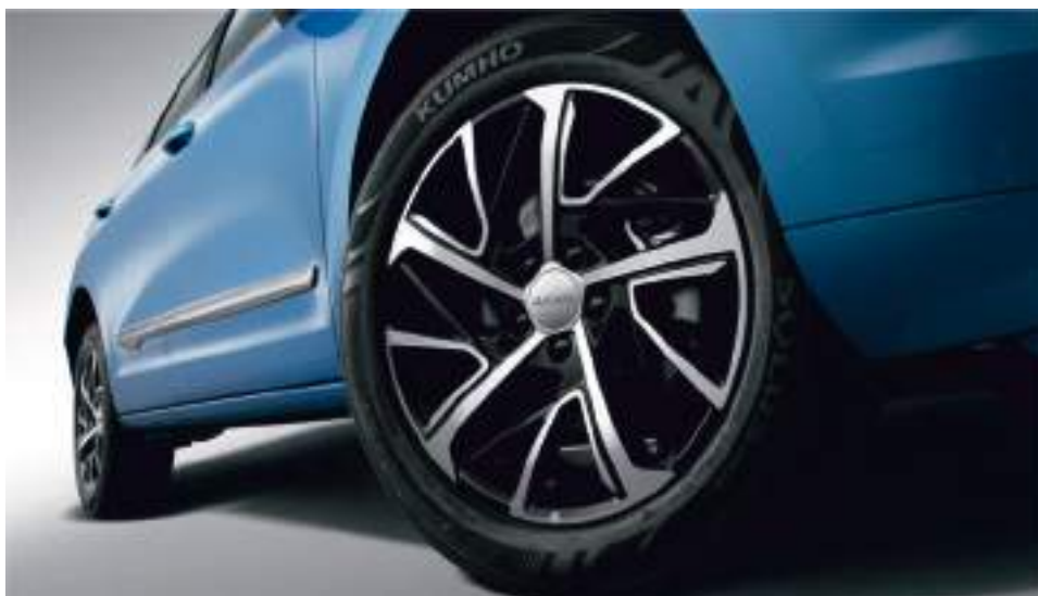
18" литые диски

Направьте свой взгляд на идеально сочетающиеся линии решетки радиатора и светодиодной оптики, а также на стильные спортивные литые диски. Это не оставит вас безвсегообщего внимания.