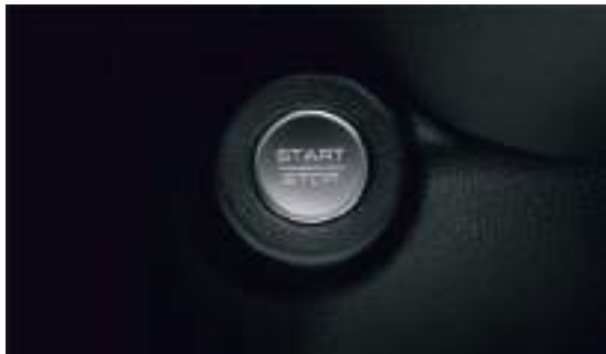
Кнопка запуска двигателя

Окружите себя всем необходимым в ежедневных поездках в городе или автопутешествиях.