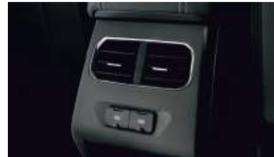
По 2 USB-разъема спереди и сзади