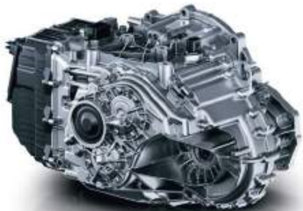
7-ступенчатая коробка передач с двойным сцеплением «мокрого» типа

Положитесь на надежный двигатель с выверенными пропорциями, улучшенными** показателями мощности и экономичности и продвинутую коробку передач с мгновенным откликом переключения.