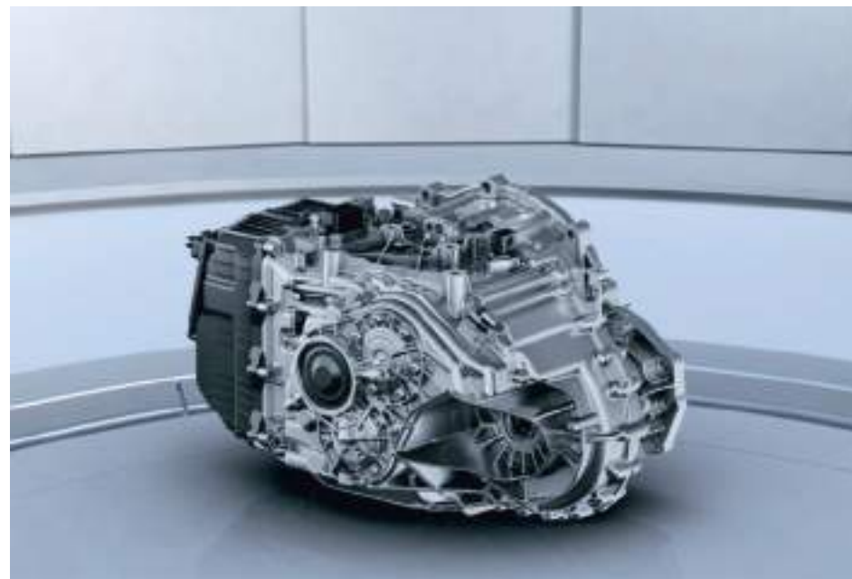
7-ступенчатая роботизированная коробка передач «мокрого» типа

Двигатель работает в паре с 7-ступенчатой роботизированной коробкой передач мокрого типа. Благодаря такой связке кроссовер разгоняется быстро и плавно. Также среди ее преимуществ — экономичность, способность передавать крутящий момент от двигателя к колесам без существенных потерь.