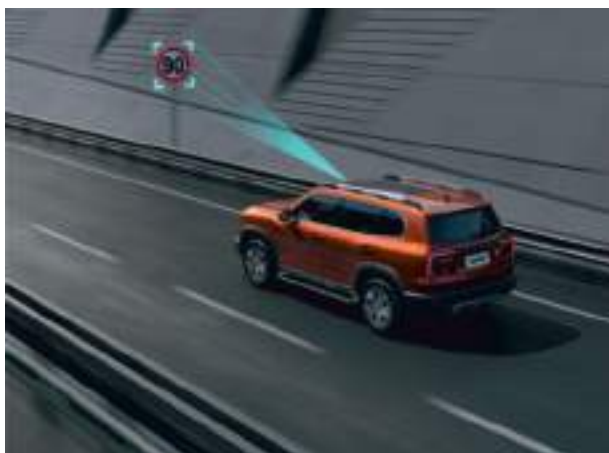
Система распознавания дорожных знаков