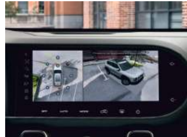
Система камер кругового обзора 360°