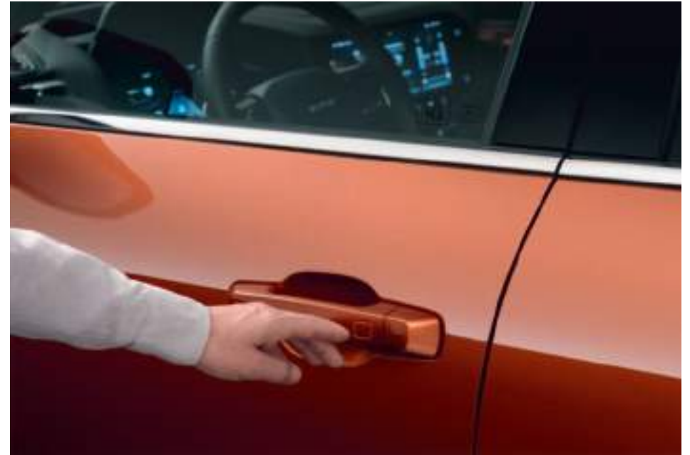
Система бесключевого доступа

А система бесключевого доступа позволяет легко попасть в салон: вы можете открыть двери, не доставая ключа из кармана.