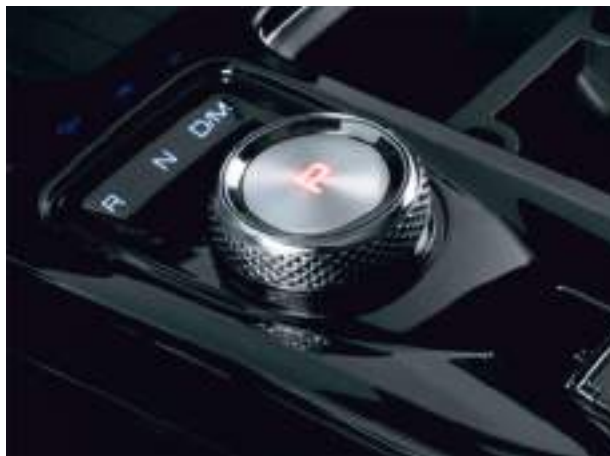
Электронный джойстик коробки передач

Система камер кругового обзора 360° передает картинку высокого разрешения на большой дисплей мультимедийной системы 12,3" и помогает легко объезжать труднозаметные препятствия