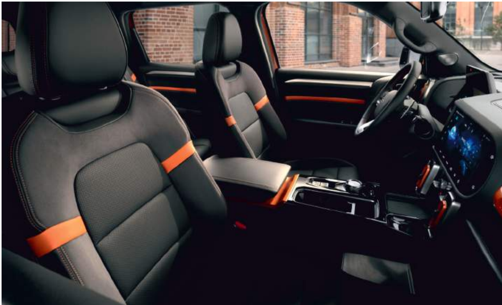
Передние сиденья обшиты натуральной кожей с перфорацией