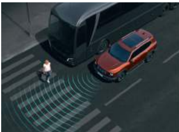
Автоматическая система торможения с функцией распознавания пешеходов