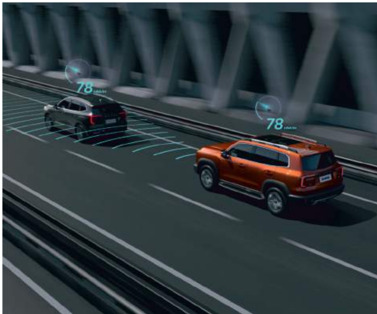
Адаптивный круиз-контроль с функцией движения на малых скоростях

Интеллектуальный полный привод Haval Dargo позволяет выбирать из 8 режимов вождения («Эко», «Спорт», «Стандарт», «Снег», «Грязь», «Песок», «Трава/Гравий», «Ухабы»), чтобы вы чувствовали уверенность на любом типе покрытия. Кроссовер оснащен системой поддержания постоянной скорости на бездорожье. Она распределяет тягу двигателя так, чтобы колеса не проскальзывали. Это поможет не увязнуть в глубоком снегу, песке или грязи. Система помощи при спуске и подъеме поможет безопасно преодолеть опасный склон, поддерживая нужную скорость, и не даст вам откатиться назад при старте в горку. Благодаря дорожному просвету 200 мм и коротким свесам переднего и заднего бампера кроссовер может двигаться по неровному и сложному покрытию: он справится как с каменистой дорогой, так и с глубокой колеей.