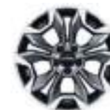
18" литые диски