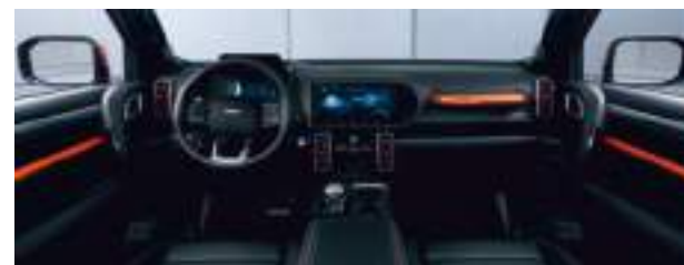
Черный с оранжевыми вставками (черный потолок)