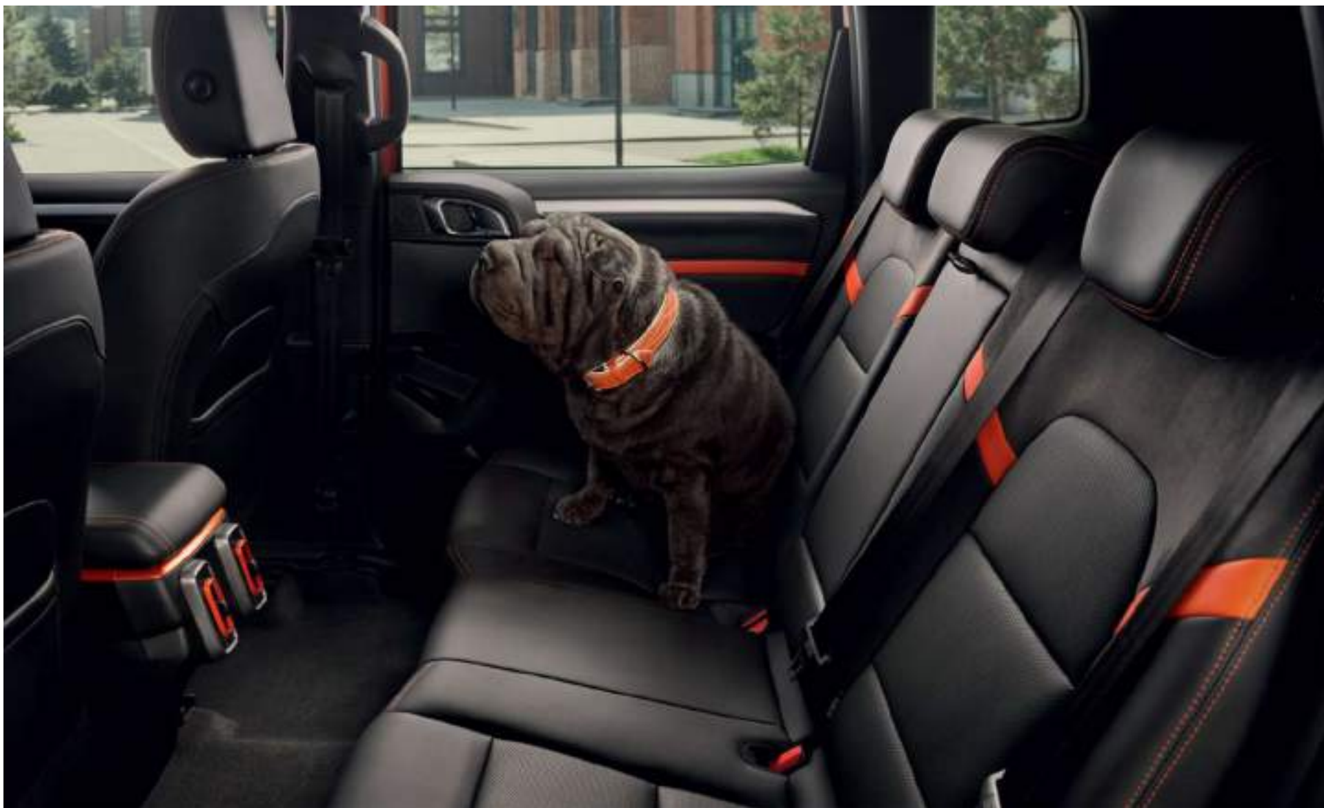
Ровный пол на заднем ряду позволяет с комфортом разместиться трем пассажирам