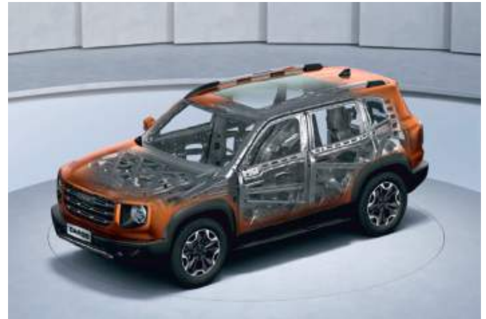
Запрограммированные зоны деформации

Продуманная конструкция кузова обеспечивает уверенность в каждой поездке. За это отвечают запрограммированные зоны деформации — это специальные части каркаса, которые принимают на себя всю нагрузку во время столкновения. Таким образом водитель и пассажиры надежно защищены прочным коконом