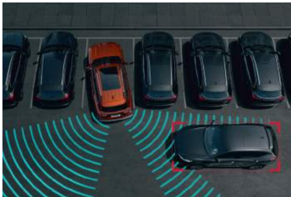
Система помощи при выезде с парковки задним ходом

Система помощи при выезде с парковки задним ходом предупредит вас о приближающейся опасности и поможет предотвратить столкновение.