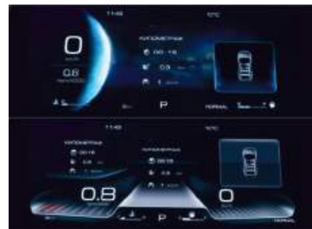
Цифровая панель приборов 10,25"