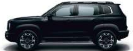
Галактический черный/ Черный нефрит