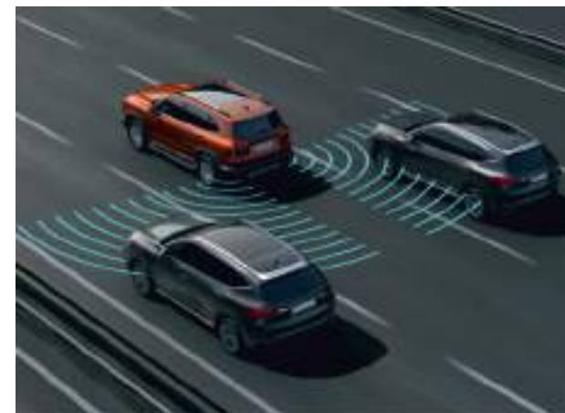
Система мониторинга слепых зон