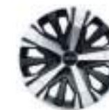
18" литые диски