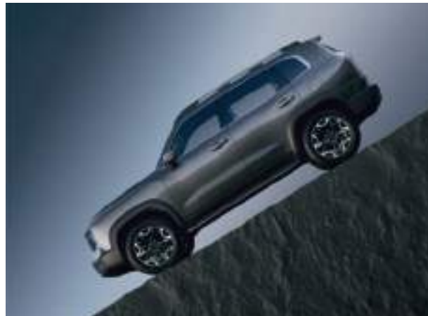
Система помощи движения по склону