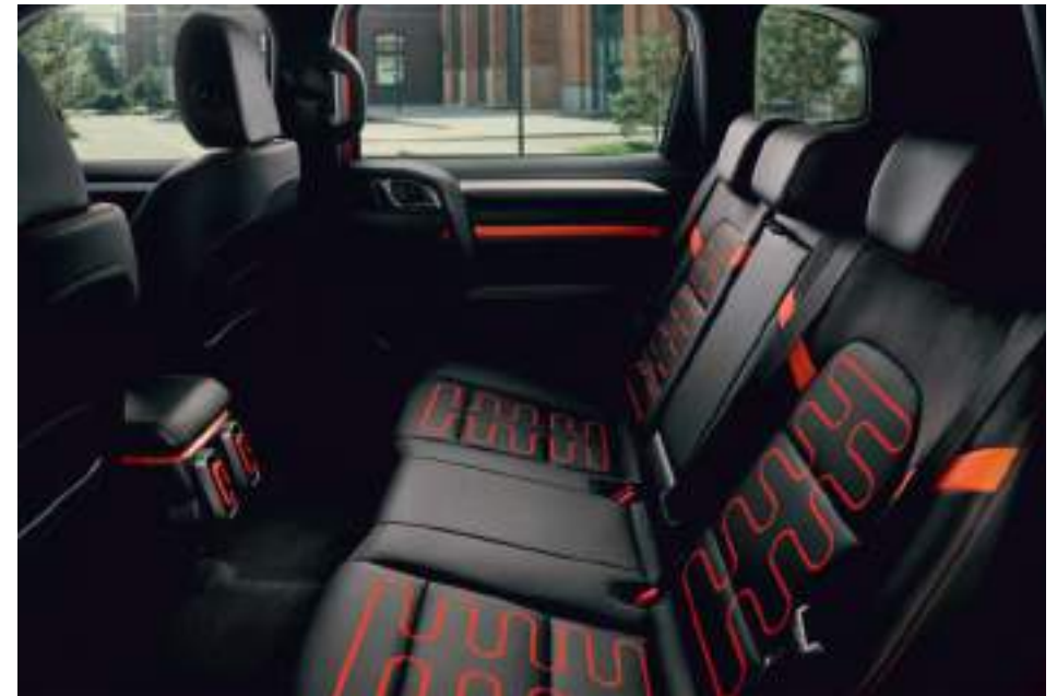
Подогрев задних сидений

Пассажиры заднего ряда тоже останутся довольны поездкой. Ведь салон заполнен естественным светом благодаря большой панорамной крыше, которая вдобавок визуально увеличивает пространство. А удобные сиденья также оснащены функцией трехуровневого подогрева подушки и спинки.