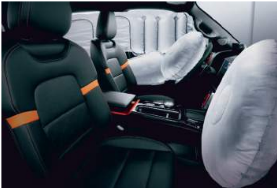
7 подушек безопасности

HAVAL DARGO создан, чтобы за его рулем вы ощущали спокойствие. Поэтому 7 подушек безопасности расположены так, чтобы защитить водителя и пассажиров от серьезных травм: две фронтальные и боковые подушки спереди, еще одна под рулевым колесом и шторки безопасности вдоль всего салона.