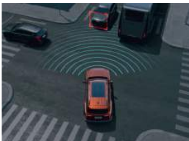
Ассистент проезда перекрестков