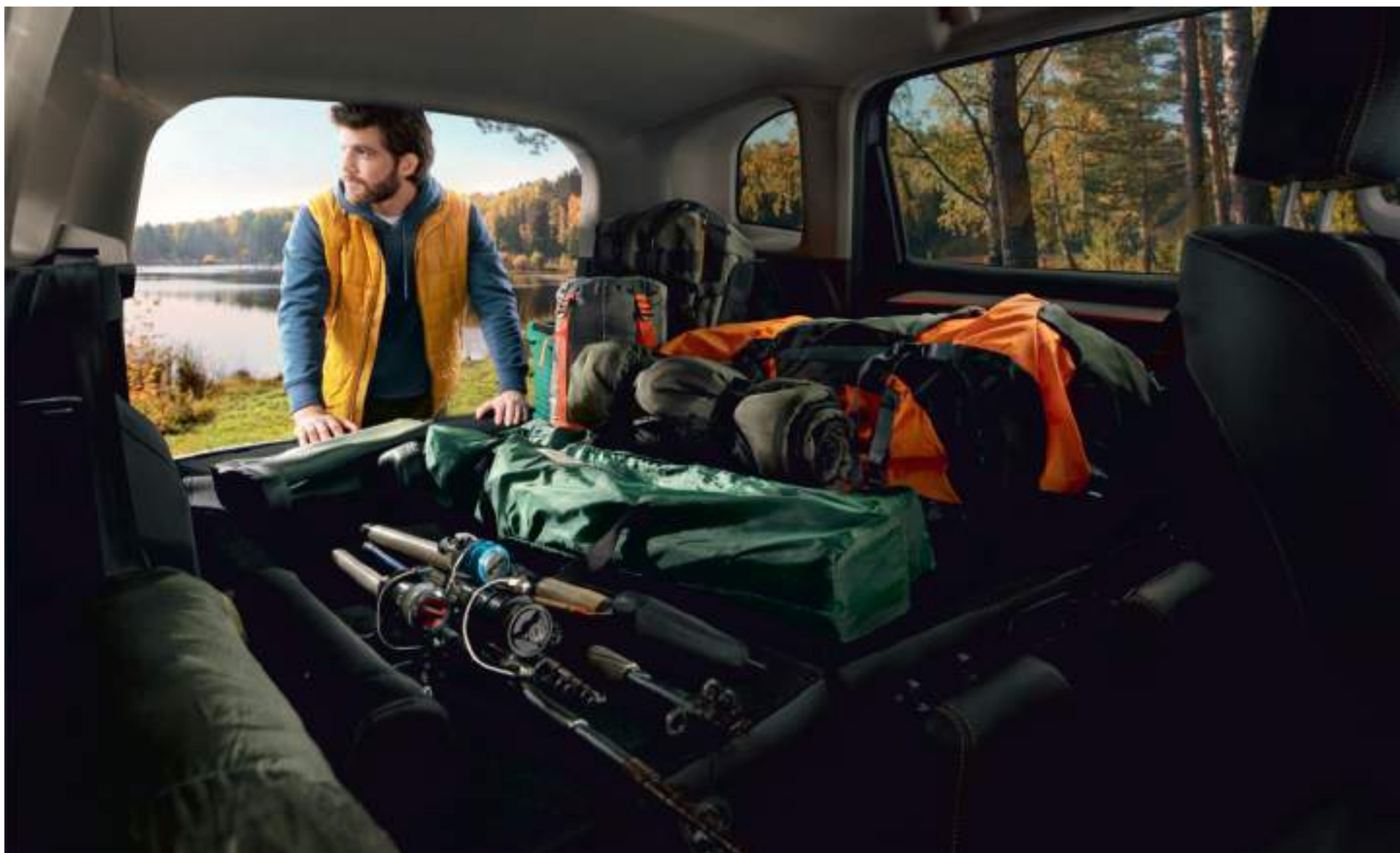
Сиденья заднего ряда складываются в соотношении 60:40 и образуют ровный пол