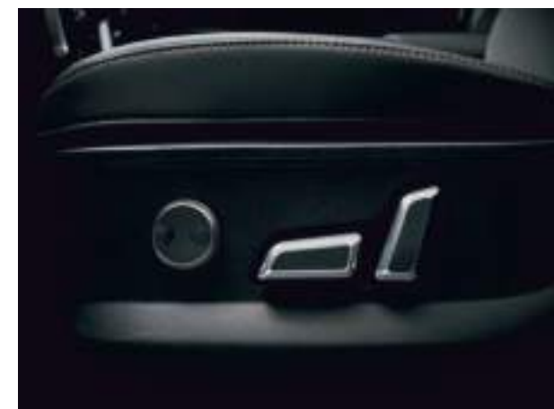
Электрорегулировка сиденья водителя в 8 направлениях