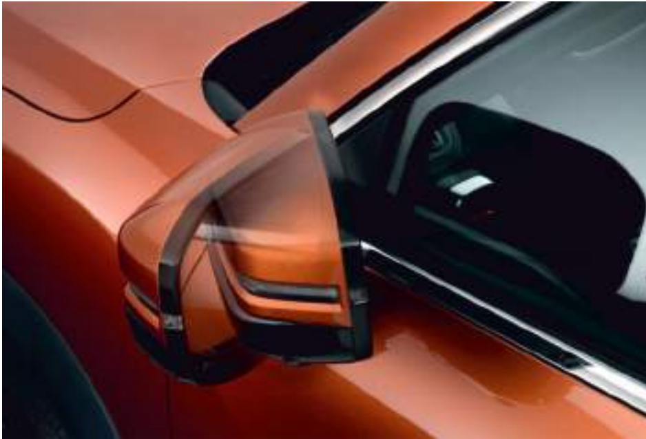
Зеркала с электроприводом складывания

Зеркала с электроприводом делают жизнь каждый день немного проще. Вам не придется складывать их вручную — они сделают это автоматически, когда вы закроете автомобиль.