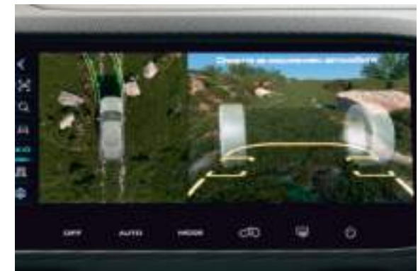
Функция «Прозрачный капот»

С ней вы сможете легко объехать трудноразличимые препятствия, не покидая салона. Функция «Прозрачный капот» особенно полезна на узких и сложных участках дороги.