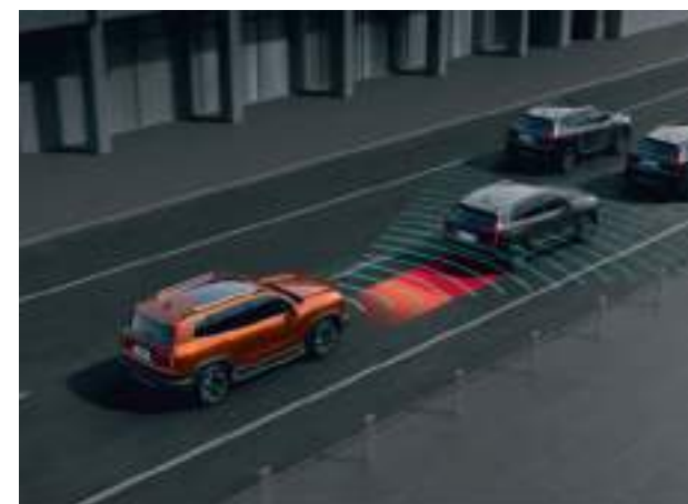
Функция движения на малых скоростях