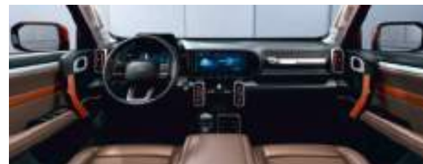
Бежевый с оранжевыми вставками*