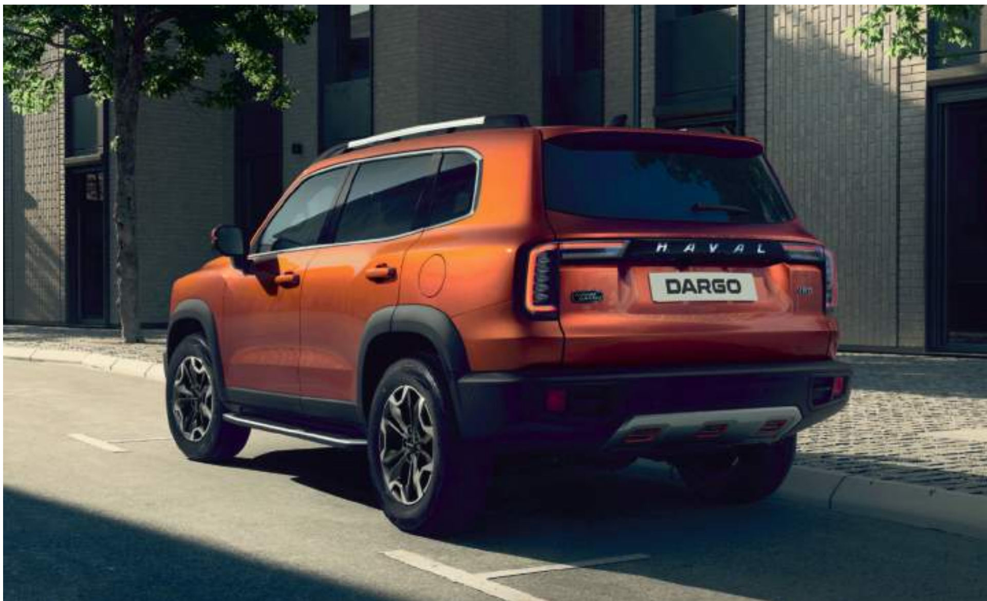
Футуристичные задние фонари и единая декоративная линия делают кузов визуально шире и выше