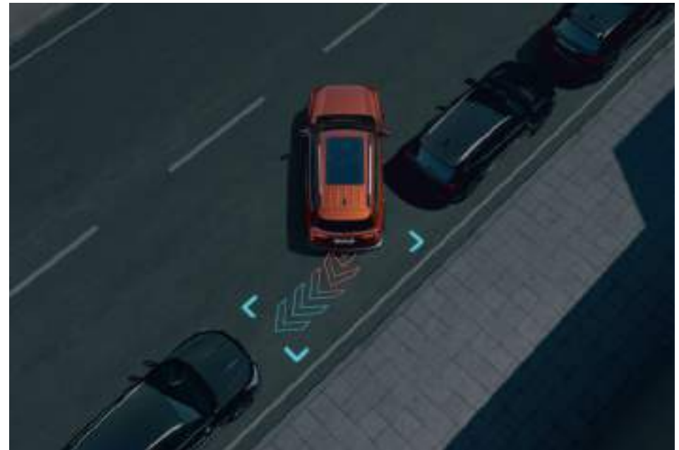
Ассистент параллельной парковки