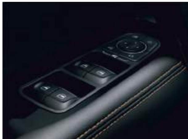
Электростеклоподъемники с автодоводчиком четырех дверей и функцией защиты от защемления

Сиденье водителя регулируется в 8 положениях, оборудовано электрорегулировкой поясничного отдела в 4 направлениях и функцией массажа.