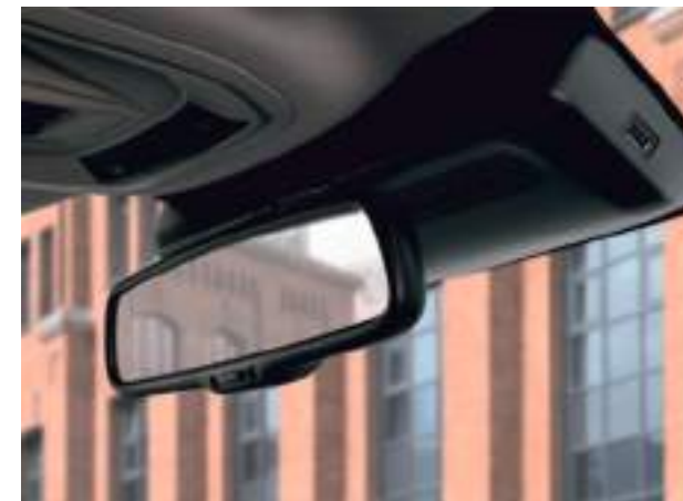
Зеркало заднего вида с автоматическим затемнением и разъемом USB для видеорегистратора