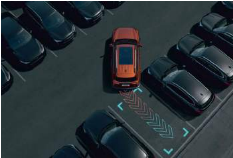
Ассистент перпендикулярной парковки

Автомобиль сам найдет место и выполнит маневр. В этом ему помогает множество наружных камер и датчиков. Благодаря им парковка происходит безошибочно и безопасно.