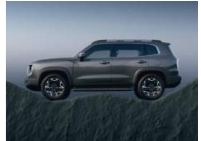
Углы въезда, рампы и съезда