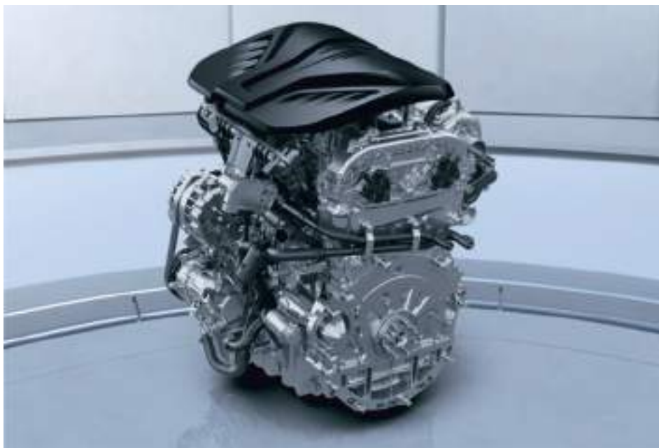
2-литровый бензиновый двигатель мощностью 192 л.с

HAVAL DARGO оснащен 2-литровым бензиновым двигателем. Это современный турбированный мотор, который выдает 192 л.с. и 320 Нм крутящего момента. Он уверенно разгоняет автомобиль и экономно расходует топливо.