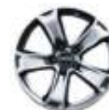
18" литые диски