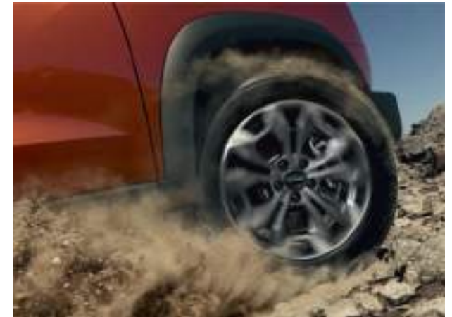
Система поддержания постоянной скорости на бездорожье