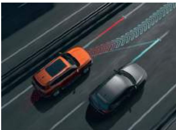
Ассистент движения по полосе